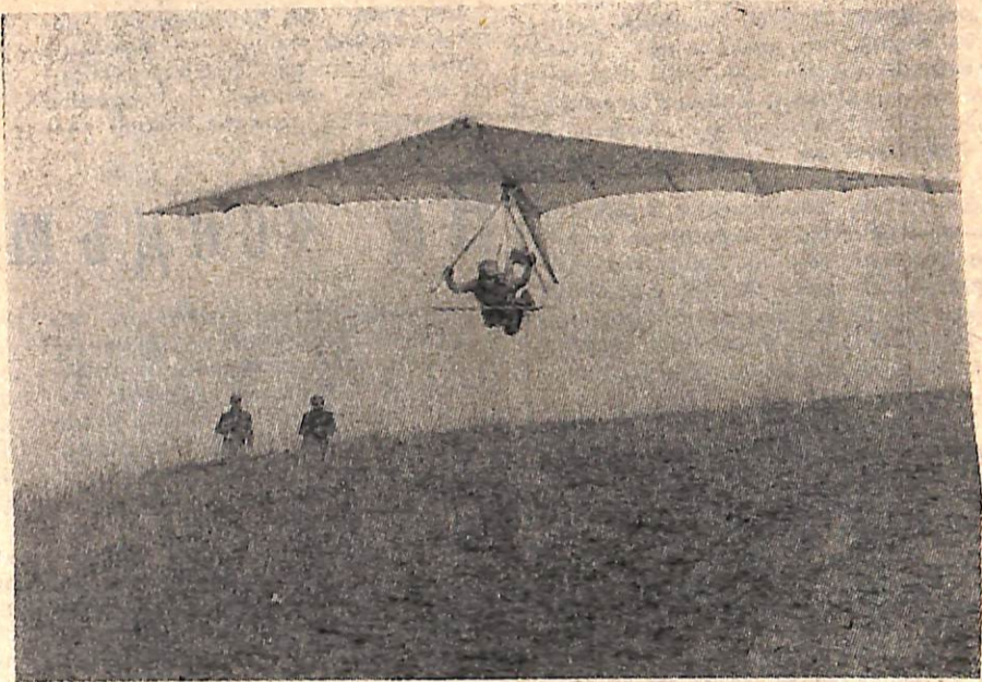
Вы хотите обрести крылья! Клуб научно-технического творчества молодежи «Полет» приглашает к себе каждого, кто желает испытать свои возможности, испробовать силы в техническом творчестве.